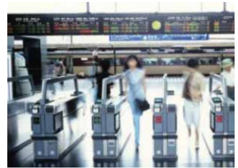
Zugangskontrolle und Ticketbuchung