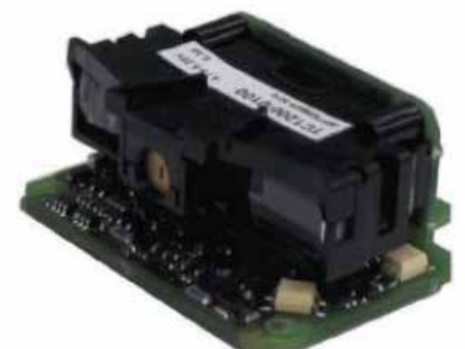
TC1200 SCAN ENGINE MODELL